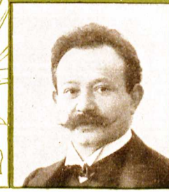
Victor Hollaender Kapellmeister in Berlin.