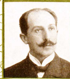
Gustav Lazarus Musikdirektor in Berlin.