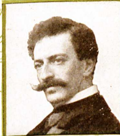
Oscar Straus Kapellmeister in Berlin.